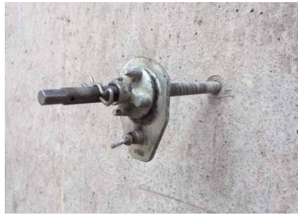
Anwendungsbeispiel: Abdichten des Bohrloches nach Einbringen eines Ankers | Example of use: Sealing of the borehole after insertion of an anchor